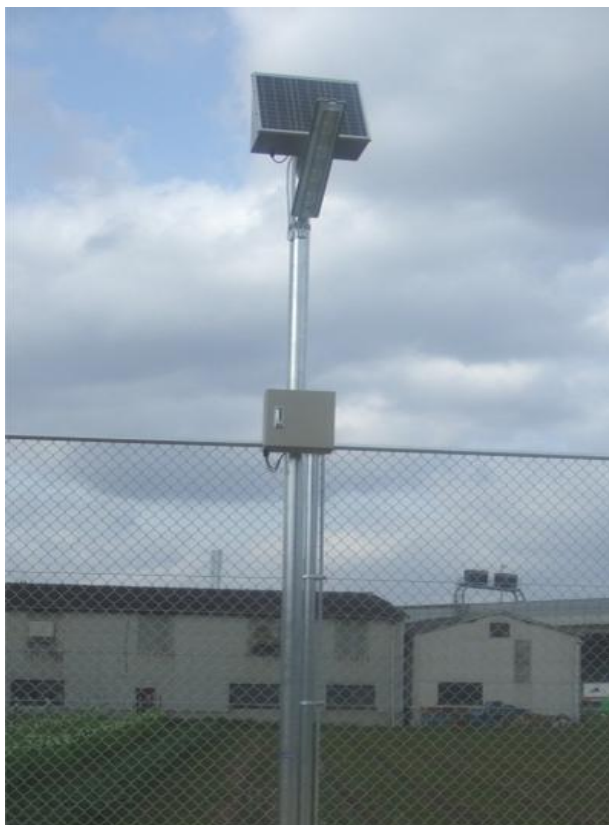
施工例：大阪府堺市美原区