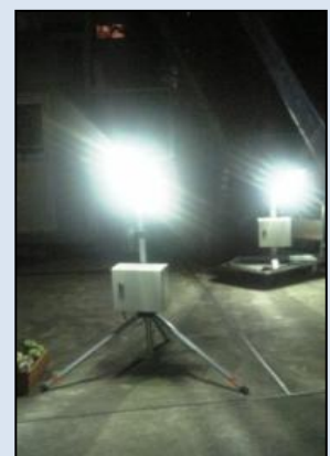
仮設スタンドの取り付け例